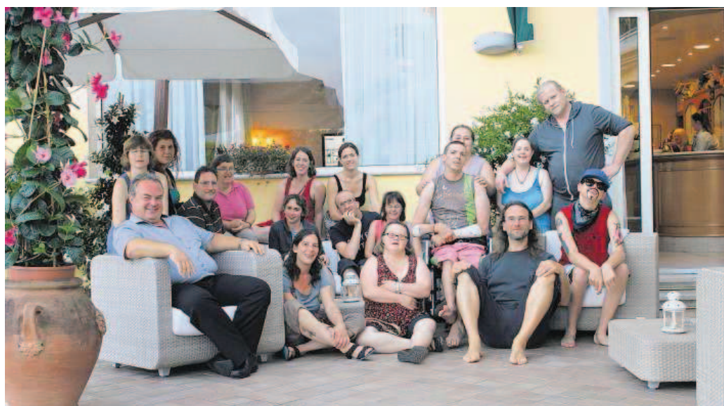
Die Freizeitgruppe Albatros weilte in der Toscana.

sonsten genoss die Gruppe das «Dolce far niente» am Strand oder am Hotelpool und liess sich dabei die Sonne auf den Bauch scheinen. Alle freuen sich jetzt schon wieder auf das nächste Jahr, wenn es wieder heisst: «Albatros goes on holiday». (eing.)