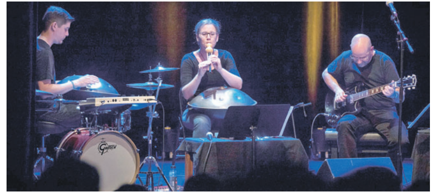
Im Dunkelzelt sind die Klanglabor-Mitglieder nicht zu sehen, aber ihre Musik erzählt mit dem Gesprochenen eine suggestive Geschichte.

Wir haben im Probelokal nicht die Möglichkeit, absolute Dunkelheit herzustellen. Also gingen wir ganz simpel vor: Alle drei trugen Schlafbrillen. Jeder setzt sie auf und von dem Moment an wird blind gearbeitet. Relativ schnell hat das auch gut funktioniert. Wir haben unser Programm sehend begonnen zu entwickeln, dann aber rasch im Dunkeln, also mit den Schlafbrillen, gearbeitet. Und dann natürlich auch gefragt, «wer hätt bschessa?». (Lacht) Aber das Klanglabor spielt mittlerweile schon so lange zusammen, dass wir uns gut kennen und wir finden sehr gut in die Klangbilder und