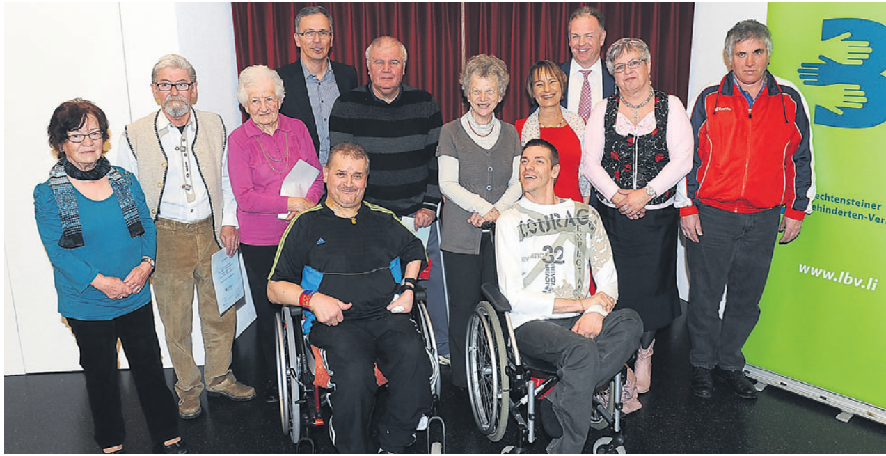
In diesem Jahr konnte der Behinderten-Verband 24 Jubilare ehren – das Foto zeigt 12 von ihnen.