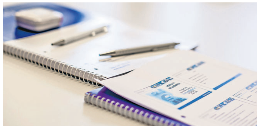
Die Bzb-Weiterbildung bietet über 180 Kurse und Lehrgänge an.

BUCHS Am Montag, den 25. März, wird im Forum des Bzb um 19 Uhr über alle Angebote für die kommenden Semester informiert. Im Angebot der Bzb-Weiterbildung finden Sie über 180 Kurse und Lehrgänge in den Bereichen Sprachen, Informatik, Wirtschaft, Technik, Gestalten und Landwirtschaft. Um sich einen Überblick über das vielseitige Angebot und seine Möglichkeiten zu verschaffen, findet am 25. März eine Informationsveranstaltung zu den verschiedenen Weiterbildungen statt. Lehrgangleitende stehen für Fragen und